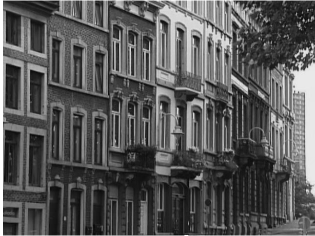
Fig.10 Imagem em preto e branco de fileiras de casas em Liège

Algumas fotos digitais as vezes ficam um pouco fora de foco ou perdem um pouco o foco ao sofrerem alterações de outras ferramentas. Para aumentar a definição da sua imagem existem as ferramentas "unsharp mask" (máscara de desfocagem) e "sharpen" (aguçar) no Gimp. Ambas são encontradas no menu Filters->Enhance. Com "unsharp mask" você geralmente obtém um resultado melhor já que este método realça as bordas dos objetos da imagem. Em muitos casos você ficará satisfeito em aplicar essa ferramenta usando os valores padrões.