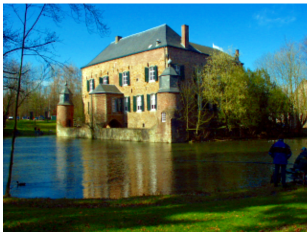
Fig.9 Foto do Kasteel Erenstein depois de aplicado a ferramenta Enhance Colors (Image->Colors->Auto->Enhance Colors), a foto ainda está um pouco escura no plano de fundo mas o castelo está bem iluminado e se destaca na vista.