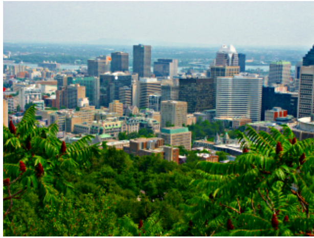
Fig.5 Vista de Montreal a partir do Mont Royal depois de ter alterado a foto com Gimp (Image --> Color-->Levels, depois clique em "auto", Image-->Color-->Hue-Saturation, movendo as barras de rolagem para a direita com a opção "master" selecionada e Filter-->Enhance-->Unsharp Mask (veja abaixo))