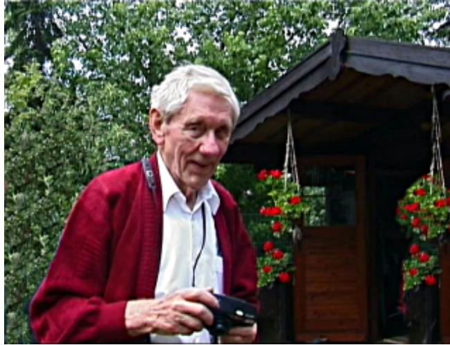
Fig.18 Foto do meu avô após ter utilizado a ferramenta de clonagem