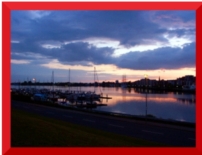
Fig.19 Foto de Wilhelmshaven com uma moldura vermelha

Para dar mais foco e atenção a sua imagem você pode emoldurá-la. Gimp oferece inúmeras possibilidades para isto. .