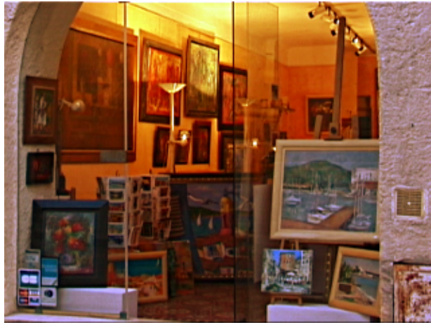
Fig.3 A loja em St. Tropez