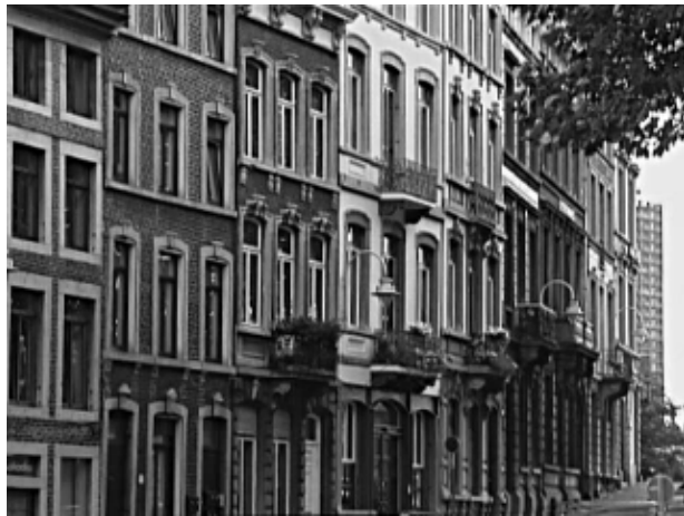
Fig.11 A mesma fileira de casas após aplicar "Unsharp Mask"

Você só deve usar esses filtros depois de já ter feito todas as outras modificações desejadas já que algumas ferramentas (e.g. redimensionar a foto) podem mudar a definição da imagem.