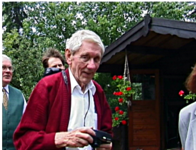
Fig.17 Foto do meu avô

Alguns erros na foto como uma árvore que aparece atrás de uma pessoa pode ser corrigido dessa forma.