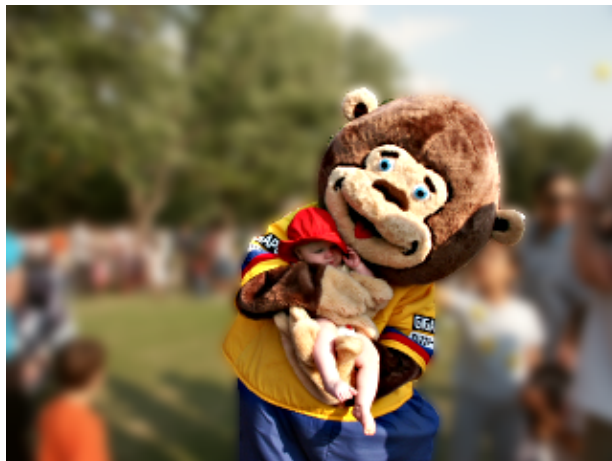
Fig.13 Urso com Jessica na "Fête des Enfants" em Montreal com o plano de fundo desfocado