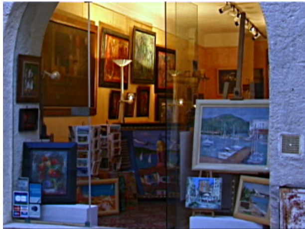
Fig.1 Loja em St. Tropez um pouco azulada

Se a foto está um pouco mais iluminada ou mais escura você pode trabalhar nisso com a Ferramenta de Curvas (Image->Colors->Curves). Se você mover a curva um pouco acima a foto fica mais iluminada e se você movê-la para baixo ela ficará mais escura. Mas você também tem a possibilidade de modificar os valores cromáticos do vermelho, verde e azul individualmente. Por causa disso esta ferramenta é bastante adequada para lidar com molde de cor. No exemplo a loja em St. Tropez está um pouco azulada: