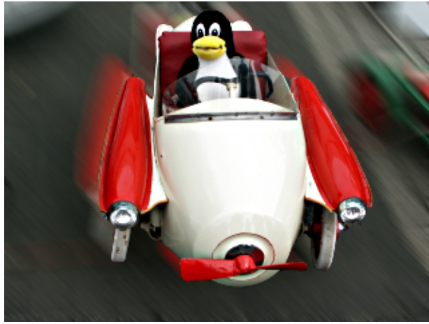
Abb.16 Tux dirigindo um Clássico