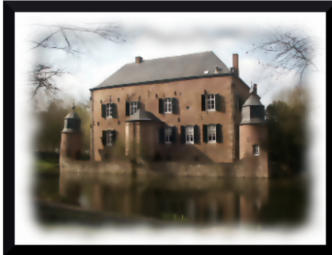
Fig.14 Kasteel Erenstein com um visual mais suave depois de aplicar desfocagem gaussiana seletiva e um frame adicionado com Script Fu-->Decor-->Fuzzy Border

Com uma câmera não-digital você pode obter uma imagem com aparência suave diminuindo a velocidade do obturador. Mas é claro que mais tarde você pode criar esse efeito com o Gimp. A ferramenta de desfocagem pode ser muito bem utilizada para este fim. A foto obtém um visual mais suave e pode parecer até mais romântica. Selective Gaussian Blur (ou Desfocagem Gaussiana Seletiva em Filters->Blur->Selective Gaussian Blur) é o melhor a se usar aqui já que o filtro de desfocagem irá ser aplicado apenas nas áreas que não possuem grandes contrastes.