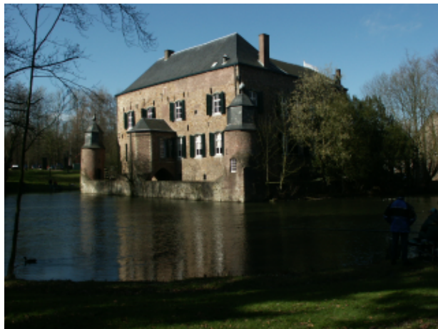
Fig.6 Foto do Kasteel Erenstein (Castelo Erenstein) um pouco escura

Se uma foto está apenas um pouco descolorida em decorrência de um dia nublado e o limite cromático está ok você pode ter uma imagem mais colorida com Image->Colors->Auto->Color Enhance. A atmosfera da foto parecerá mais "aquecida" dessa forma de maneira que você pode tentar usar essa ferramenta mesmo em fotos que já gozam de uma boa aparência. Com algumas fotos as cores ficarão pouco naturais contudo. Se você ainda quer uma foto com uma aparência mais aquecida tente Hue-Saturation e aumente a saturação (a opção "master" precisa estar selecionada para aplicar o efeito em toda a imagem).