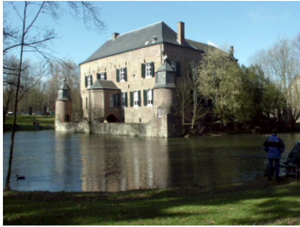
Fig.7 Foto do Kasteel Erenstein após aplicar a Ferramenta de Níveis (Levels–Tool) na imagem (poderíamos também ter usado a Ferramenta de Curvas), a foto está mais iluminada agora, mas ainda lhe falta cor.