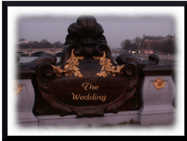
Fig.22 Aqui está a foto personalizada após a inserção do texto.

Claro que o Gimp nem sempre faz milagres transformando fotos ruins em boas fotos. E nem sempre é possível escrever um livro com receitas para cada foto já que cada ferramenta realiza um efeito diferente a depender da foto escolhida. Mas ainda acho que este artigo será bastante útil para que você possa obter o melhor das suas imagens!