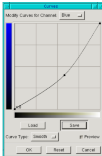
Fig.2 A Ferramenta de Curvas