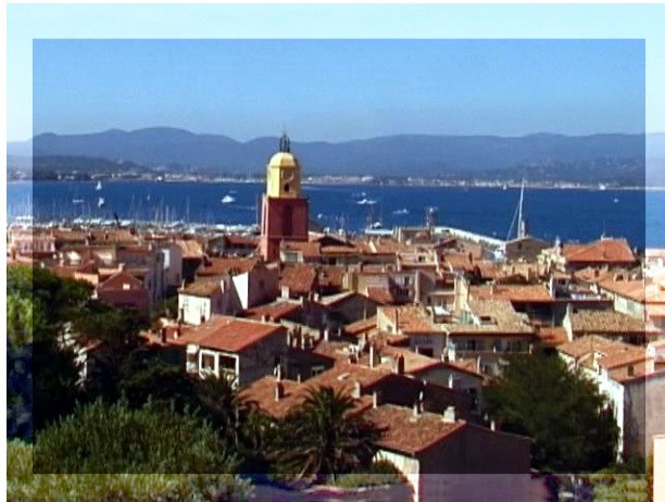
Fig.21 Foto de St. Tropez com borda iluminada

Outra possibilidade é selecionar a parte da imagem que você realmente quer visualizar. Depois de selecioná-la com a ferramenta de seleção, inverta a seleção (Selection → Invert) e mude e.g. o brilho da borda (e.g. com a ferramenta de curvas), etc.