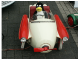
Abb.15 ux dirigindo um Clássico

Se você quer dar uma impressão de movimento o filtro Motion Blur (Filters-->Blur-->Motion Blur) fará isso muito bem. O visual original é este: