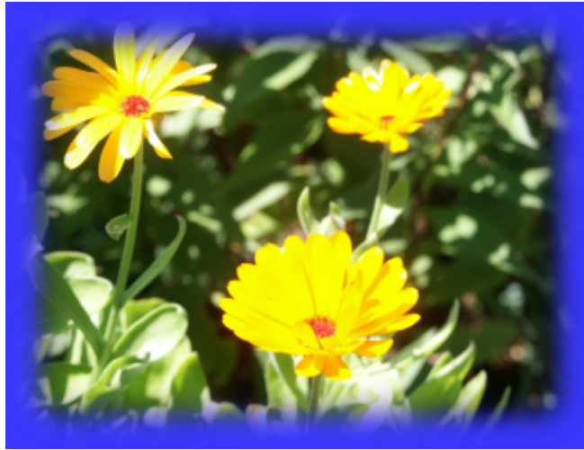
Fig.20 Flores com borda Fuzzy

Outra possibilidade é selecionar a parte da imagem que você realmente quer visualizar. Depois de selecioná-la com a ferramenta de seleção, inverta a seleção (Selection → Invert) e mude e.g. o brilho da borda (e.g. com a ferramenta de curvas), etc.