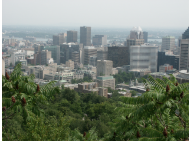
Fig.4 Vista de Montreal a partir do Mont Royal num dia nublado

Algumas fotos não utilizam todo o limite cromático. Portanto elas tendem a parecer um pouco aczentadas. É aí que entra a ferramenta de níveis. Frequentemente ir em Image->Colors->Levels e clicar em "Auto" já é satisfatório. Se não ficar satisfeito com o resultado você pode facilmente fazer tudo na mão: Vá olhando para as curvas e movendo as setas para que o espaço nos finais não fique mais vazio. Se a opção "Value" estiver selecionada acima, a ferramenta irá aplicar as modificações para a foto por completo mas pode-se fazer separadamente para cada cor, o que geralmente produz um resultado melhor. Movendo as duas setas para o final geralmente escurece mais a foto o que pode ser corrigindo movendo a seta entre os extremos.