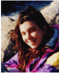
by Katja Socher <katja(at)linuxfocus.org>